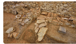
▲ 고구려의 온돌

19 다음 두 온돌 양식을 비교해 보고 알 수 있는 사실은 무엇인지 쓰시오.