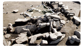
▲ 발해의 온돌