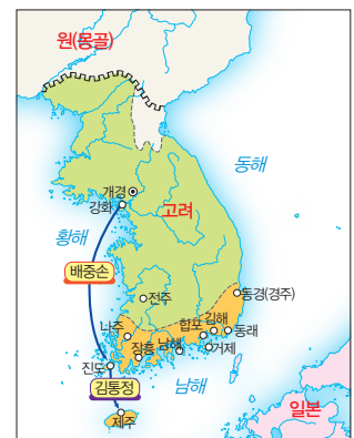
▲ 삼별초의 이동 경로