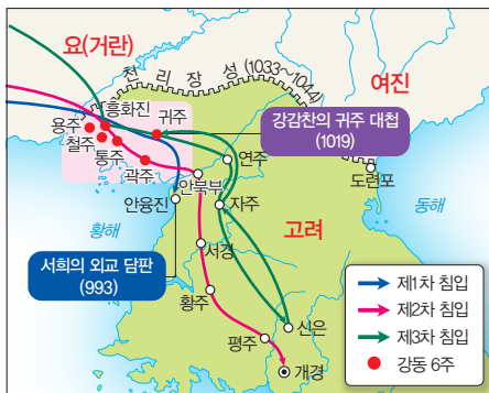
▲ 거란의 침입과 격퇴